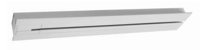
Umlenkung Glydea „Mini“ für eine ansprechende Lösung bei einteiligen Vorhängen