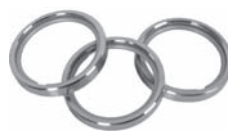
Ring 35 mm mit Gleiteinlage Art. Nr. T-5421