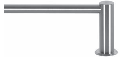
mit geschlossenen Trägern

Trägerlänge 5 cm Art. Nr. P-7010 Trägerlänge 8 cm Art. Nr. P-7011