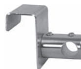
Halter 2 cm durchgehend zum Einhängen am Fensterrahmen (Rahmenstärke: 17 mm) auf Wunsch an andere Rahmenstärke anpassbar Art. Nr. P-7240