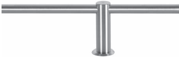
mit durchgehenden Trägern

Trägerlänge 5 cm Art. Nr. P-7010 Trägerlänge 8 cm Art. Nr. P-7011