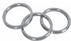
Ring 25 mm Art. Nr. D-6420