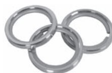
Ring 25 mm mit Gleiteinlage Art. Nr. D-6421