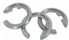
Durchschleuderring mit Gleiteinlage, inkl. Überstülphaken Art. Nr. D-6422