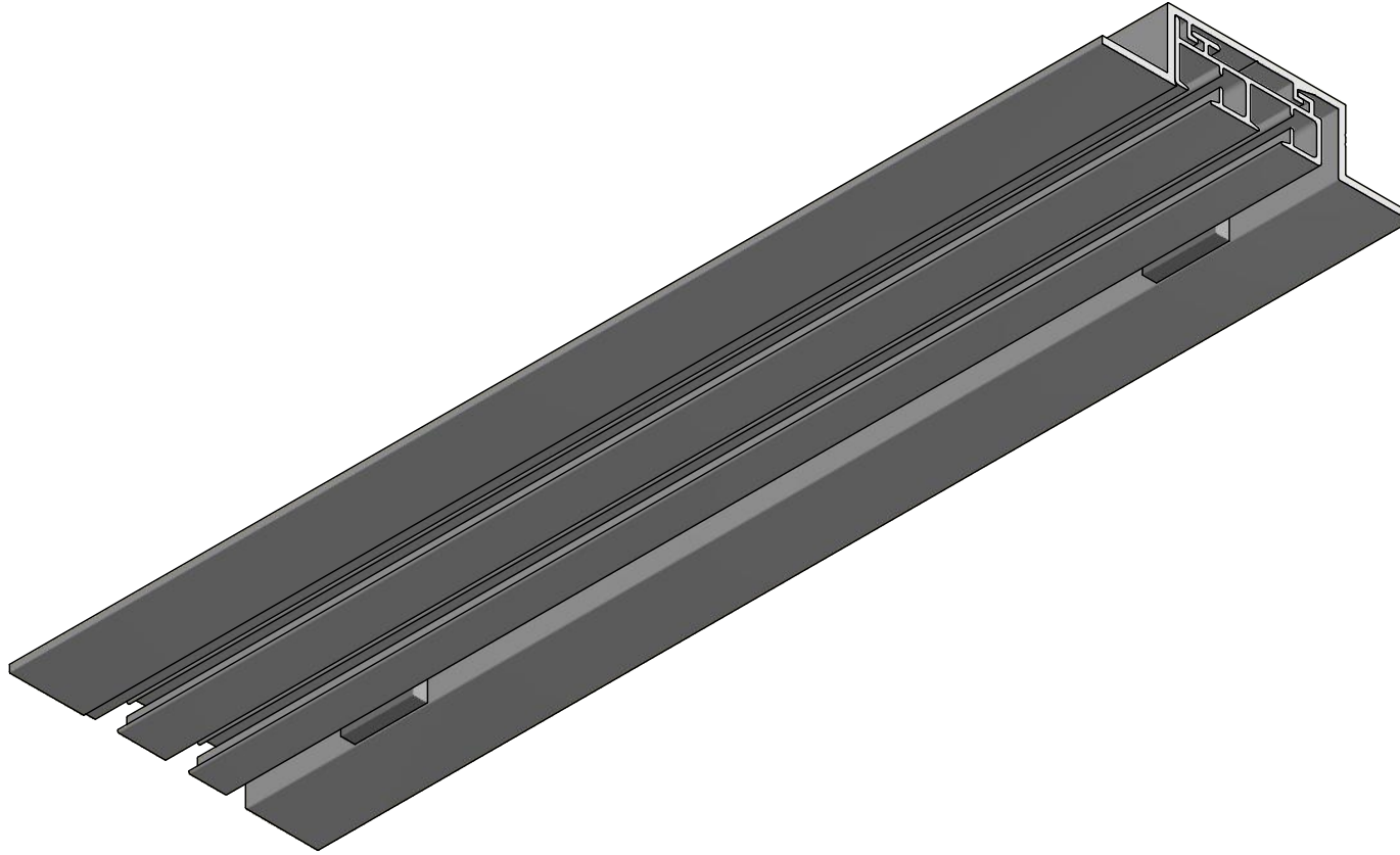
Maßstab ( 1 : 1 )