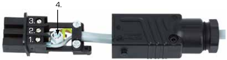
Kabelbelegung Bauseitig / Kabelpeitsche (STAK 3)