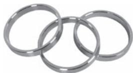
Ring 42 mm Art. Nr. V-4420