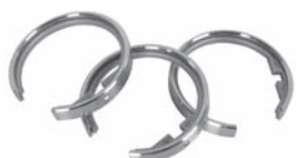
Durchschleuderring mit Gleiteinlage, inkl. Überstülphaken D: 42 mm Art. Nr. V-4422