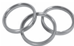
Ring 42 mm mit Gleiteinlage Art. Nr. V-4421