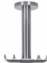
Durchschleuderträger 2-läufig für Deckenmontage Abstand Decke bis Stangenmitte 5 cm, 10 cm oder 15 cm Laufabstand = 7 cm Grundplatte D = 46 mm, Trägerstab D = 22 mm, mit 3 verdeckten Montagebohrungen 5 cm: Art. Nr. V-3330 10 cm: Art. Nr. V-3331 15 cm: Art. Nr. V-3332