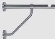
Trägerstütze für besonders lange Träger (ohne Träger)

Art. Nr. T-5330 - 5 cm Art. Nr. T-5331 - 10 cm Art. Nr. T-5332 - 15 cm