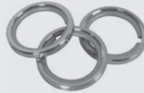
Ring 25 mm mit Gleiteinlage Durchmesser außen: 25 mm Durchmesser innen: 18 mm