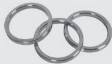
Ring 25 mm Durchmesser außen: 25 mm Durchmesser innen: 20,9 mm